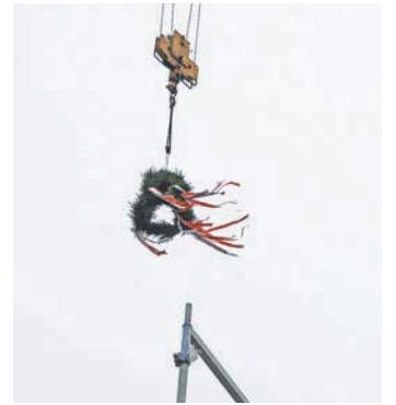
Wehete über dem Bagerüst: der Richtkranz

wir hier beispielsweise einen Notar, Makler, Praxen und Läden hineinnehmen, aber keine Gastronomie“, erklärte Tari Van Noy, bei der terra für die Geschäftsentwicklung zuständig. Die Vermietungen würden durch terra im Sommer starten und die Mieten den Neubaupreisen in Hittfeld und der übrigen Gemeinde Seevetal angepasst. Die Fertigstellung der Wohnungen ist bis Ende dieses Jahres vorgesehen. Das Baugrundstück wurde der terra durch die Buchholzer Firma Remax vermittelt.