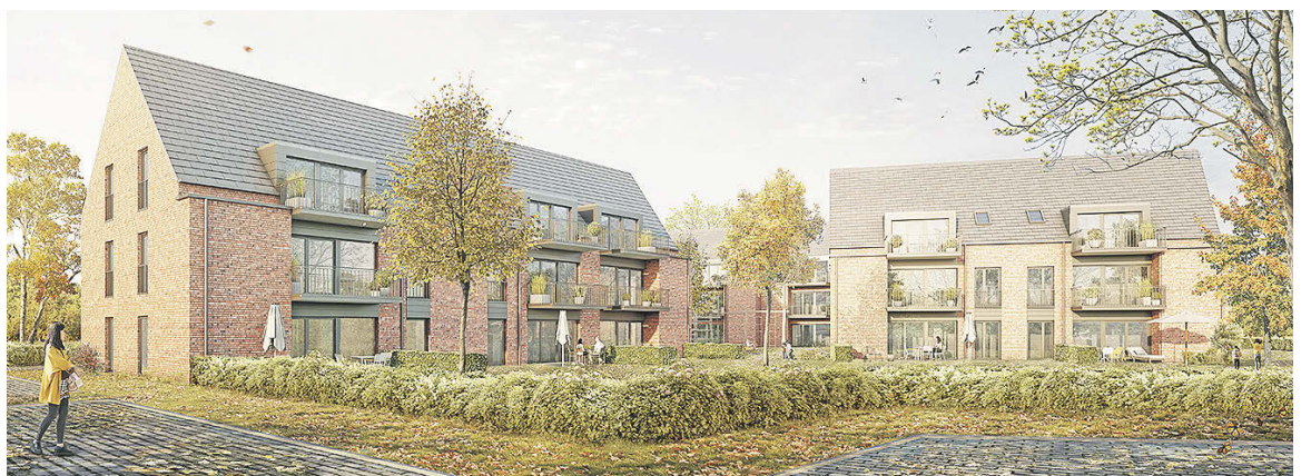
So soll der Neubau in Hittfeld im Bereich Harburger Straße / Am Göhlenbach nach der Fertigstellung Ende dieses Jahres aussehen